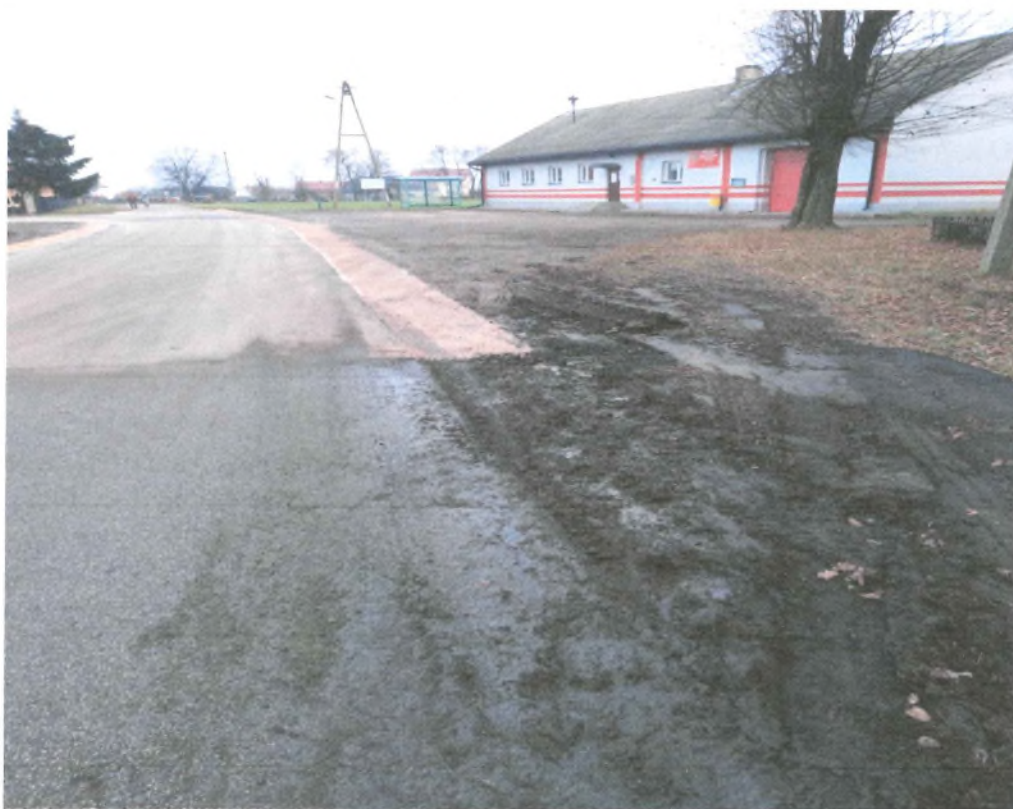
Zdjęcie Nr 2 po przebudowie dróg gminnych 17.12.2020 r. – w głębi widoczny nie utwardzony plac przy budynku OSP, pobocze nieutwardzone (błoto).