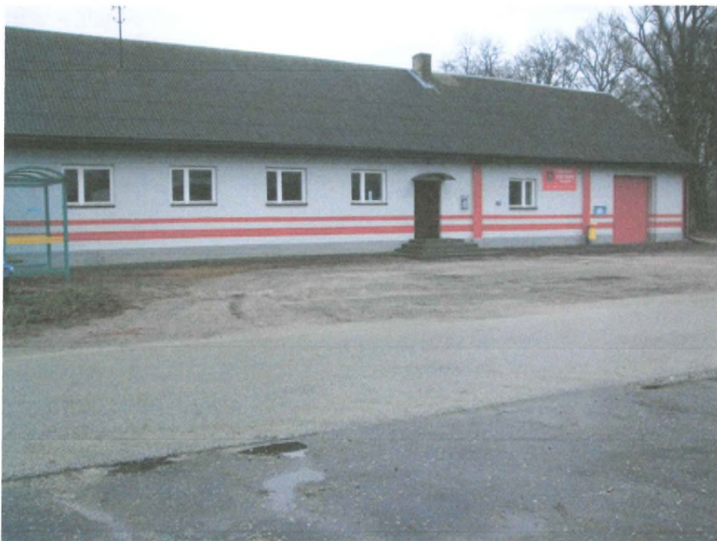
Zdjęcie 1 – Budynek OSP – Przed budynkiem widoczny plac do utwardzenia