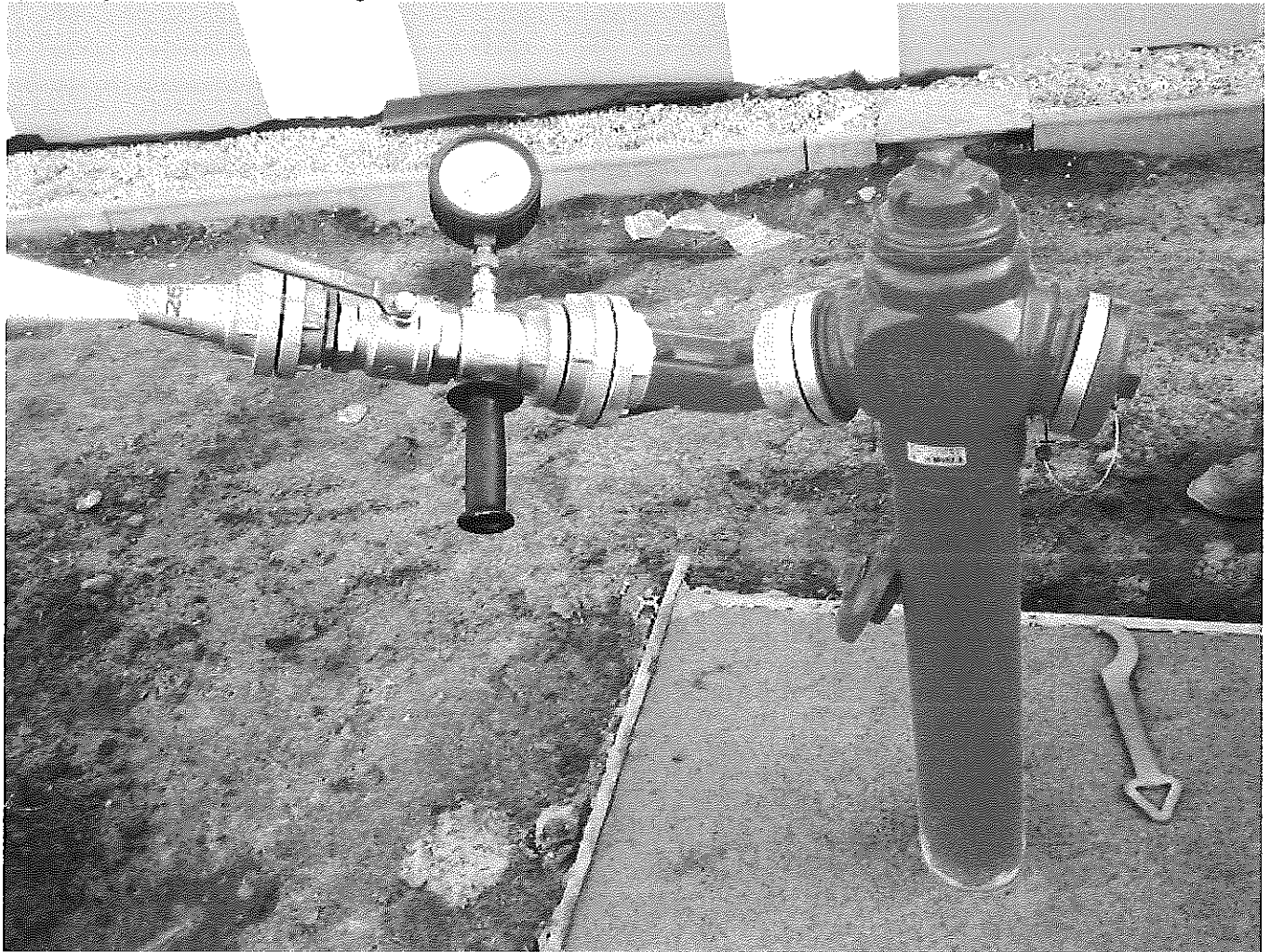
Badanie wydajności hydrantu zewnętrznego