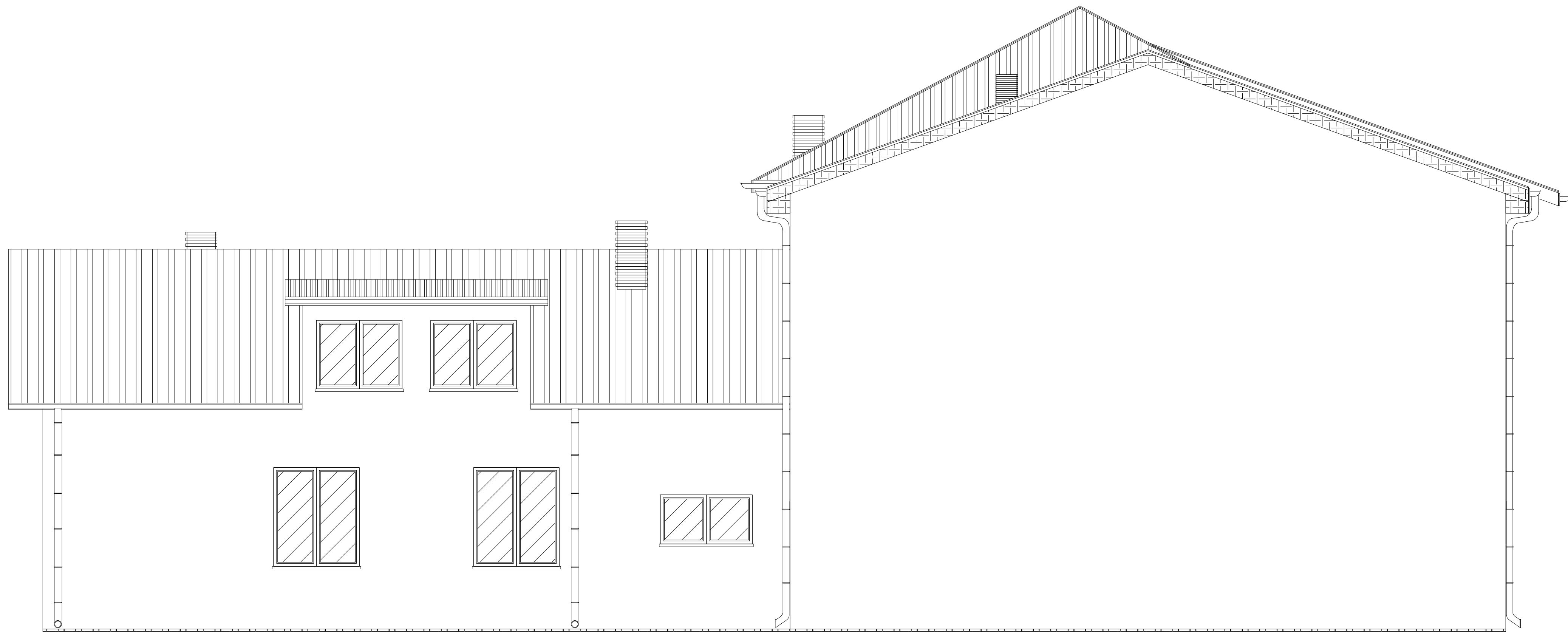
WIDOK ELEWACJI FRONTOWEJ - POŁUDNIOWEJ